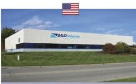
BAUD Detroit Detroit - USA