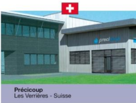
Précicoup Les Verrières - Suisse