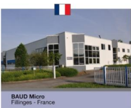
BAUD Micro Fillinges - France