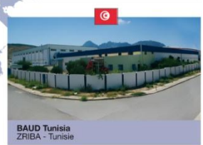
BAUD Tunisia ZRIBA - Tunisie