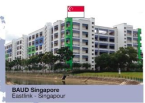
BAUD Singapore Eastlink - Singapour