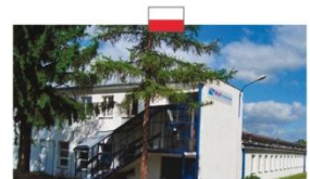
BAUD Polska Zabkowice Slaskie - Pologne