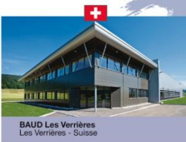
BAUD Les Verrières Les Verrières - Suisse