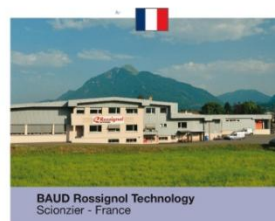
BAUD Rossignol Technology Scionzier - France